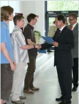
Auszeichnung der Landessieger