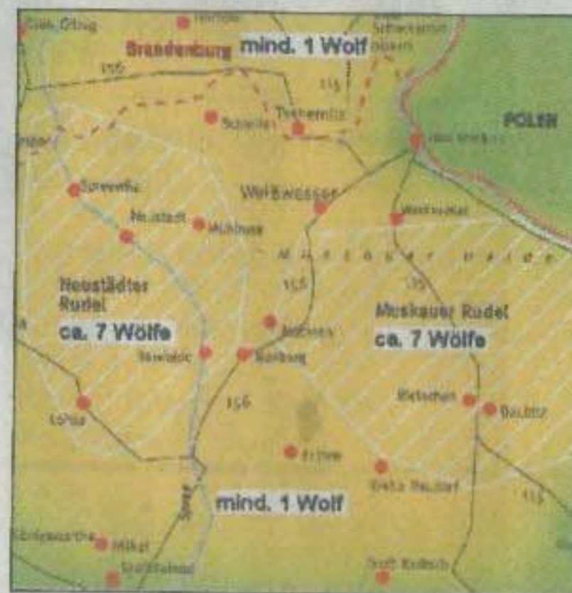
Verbreitungsgebiet Lausitzer Wölfe